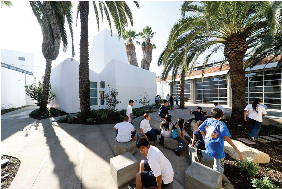
Fig. 11: Inner-City Arts Campus, Los Angeles, SUA – Michael Maltzan Architecture

Realități. Fenomenul social trebuie relaționat cu aspecte de ordin istoric, cultural, psihologic, politic, economic, tehnologic etc. pentru o înțelegere în profunzime a problemelor și nevoilor și identificarea unor soluții valide. Căutarea de soluții posibile la probleme reale, actuale, de ordin social trebuie să se facă prin raportare la istoria apariției și transformării lor, la efecte psihologice atât ale problemei, cât și ale rezolvării (înțelegerea faptului că rezolvarea propusă trebuie să poată fi apropiată de către actorii cărora le este impusă), la realitatea politică și jocurile de putere care pot influența implementarea etc. Analizarea posibilităților reale de utilizare și/sau apropiere a clădirii propuse trebuie raportată la cei cărora le este destinată, dar și la celelalte categorii de actori afectați (pozitiv sau negativ) de prezența obiectului propus. Arhitectura poate avea efecte asupra culturii, economiei, sănătății fizice și psihice, relațiilor interumane, relațiilor de putere etc. din interiorul comunităților în mijlocul cărora este inserată etc. Adecvarea arhitecturii la context, din punct de vedere antropologic, se bazează pe înțelegerea relației dintre actor – funcțiune – imagine arhitecturală – elemente de arhitectură.